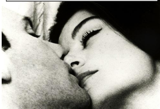
Jean-Louis Trintignant y Anouk Aimée en Un hombre y una mujer .