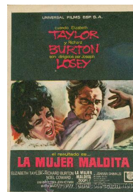
La mujer maldita (Boom, 1968) Joseph Losey

1972 otsaila 7 febrero 1972 sesión 777 emanaldia